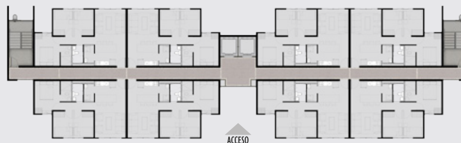
Ubicación sobre la Torre