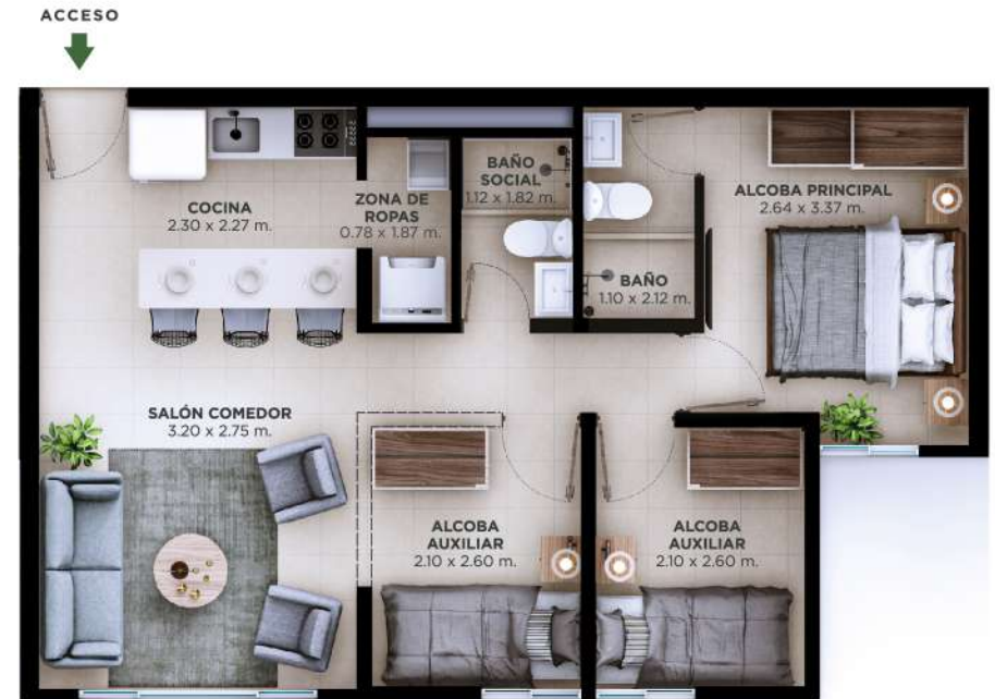
OPCIÓN DE AMOBLAMIENTO #2 - 3 ALCOBAS

RECORRE NUESTRO APARTAMENTO CON 2 ALCOBAS + ESTUDIO CON NUESTRO TOUR VIRTUAL