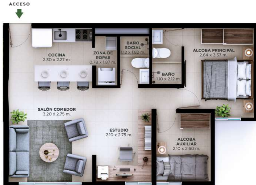
OPCIÓN DE AMOBLAMIENTO #1 - 2 ALCOBAS + ESTUDIO

ÁREA CONSTRUIDA 55.16 m 2 // ÁREA ÚTIL MÍNIMA 48.10 m 2 - MÁXIMA 49.24 m 2