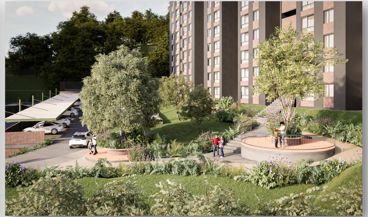
Plazoletas de descanso