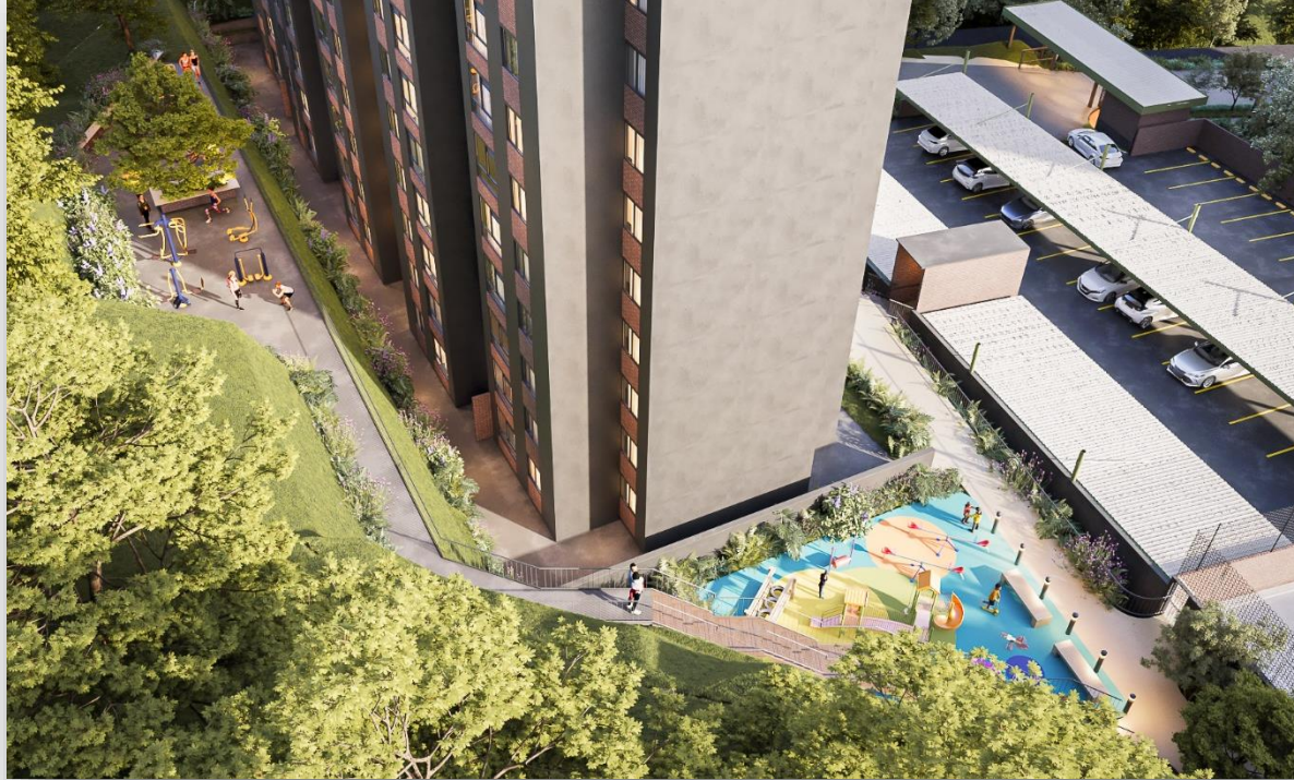
Juegos infantiles al aire libre