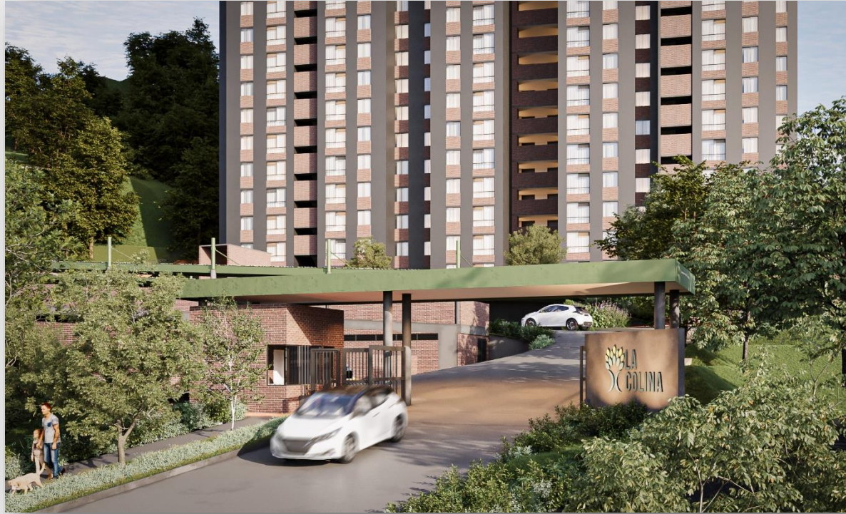
Portería La Colina