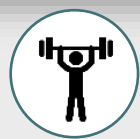
GIMNASIO AL AIRE LIBRE