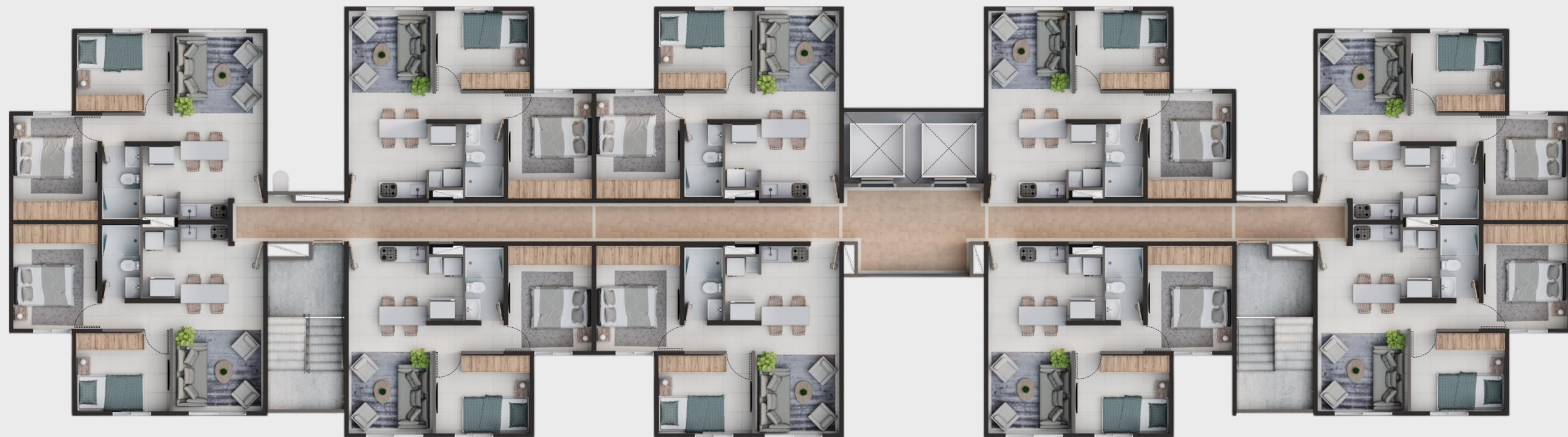
Apto B. # ___03